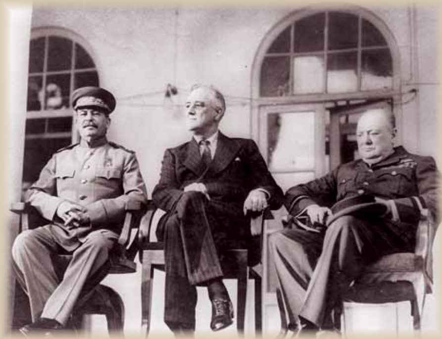
Rozhodující jednání nejvyšších představitelů budoucích válečných vítězů v Teheránu v listopadu 1943, které rozhodlo o poválečné budoucnosti Evropy

Na těchto geopolitických změnách nic nemění fakt, že konec druhé světové války v