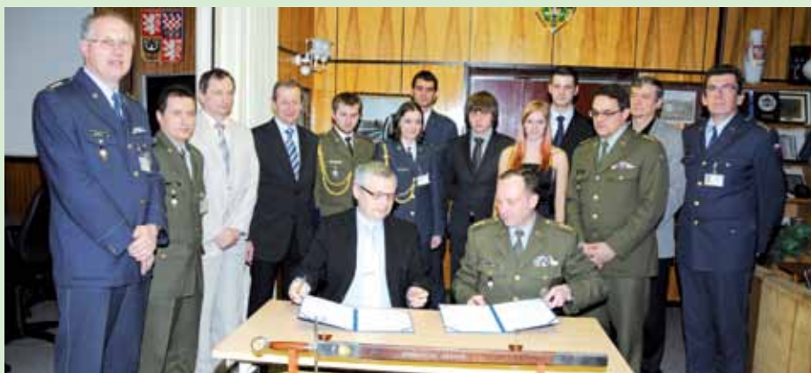
Dne 16. dubna 2013 došlo k podpisu Memoranda o spolupráci Univerzity obrany a České společnosti AFCEA a založení Studentského klubu AFCEA na Univerzitě obrany