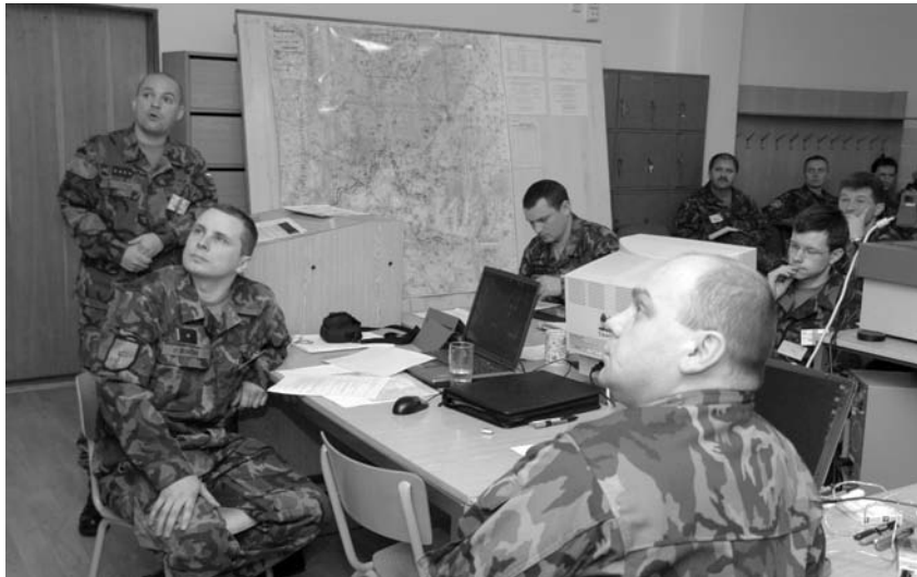
Studenti kurzu při provádění brífinku v rámci rozhodovacího procesu

Cíle byly naplněny, uvedl po skončení velitelsko-štábního cvičení řídící cvičení