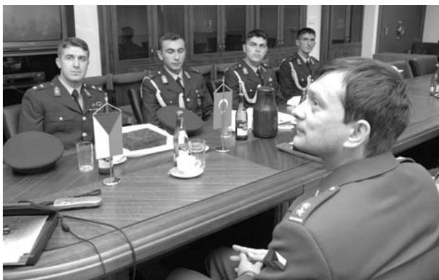
Zastupující děkan FEM přijímá tureckou delegaci