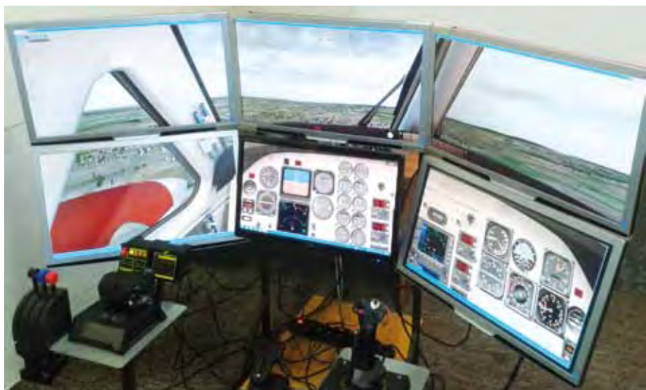
Simulátor Katedry leteckých elektrotechnických systémů pro měření lidského činitele