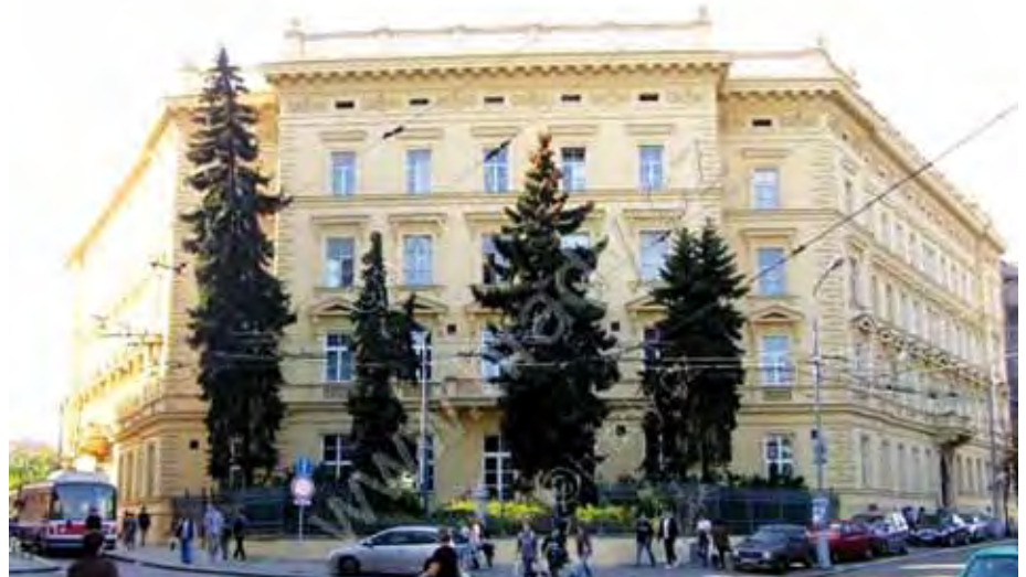
Kounicův palác – symbol vysokého školství v Brně