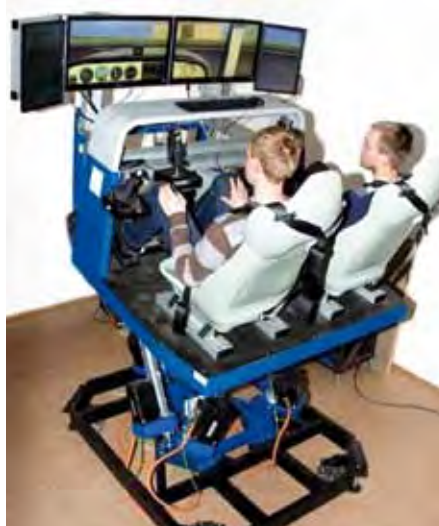
Simulátor letounu C172 s pohyblivou základnou na Katedře měření ČVUT Praha

V rámci tohoto projektu proběhlo letos v dubnu další měření chování