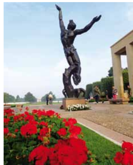
Americký hřbitov - Omaha