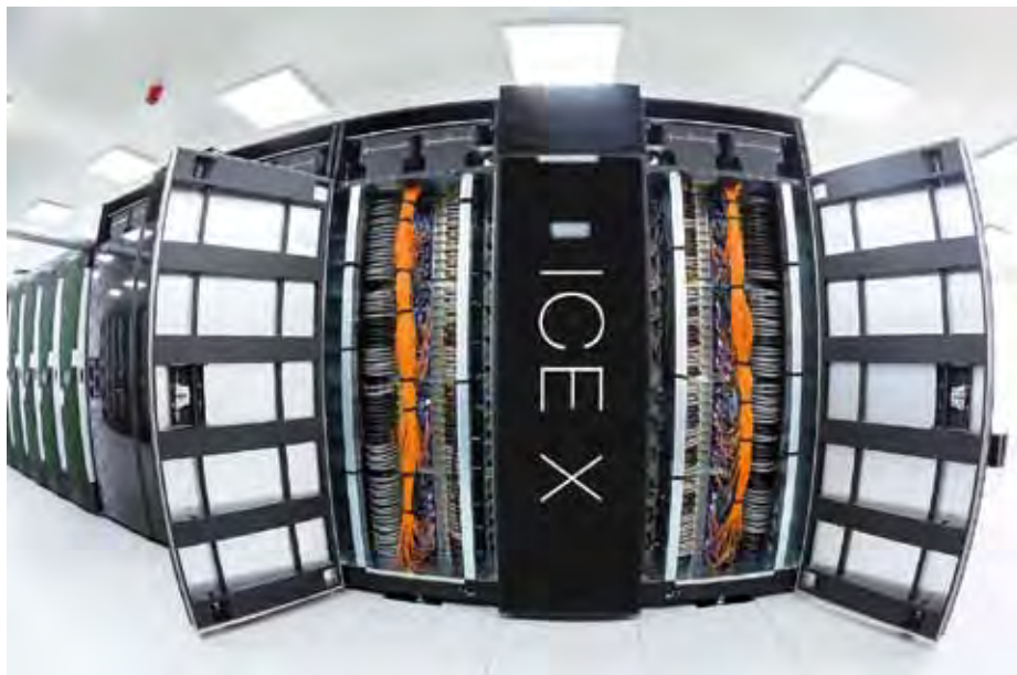
Sálový počítač Salomon v ostravském výpočetním centru