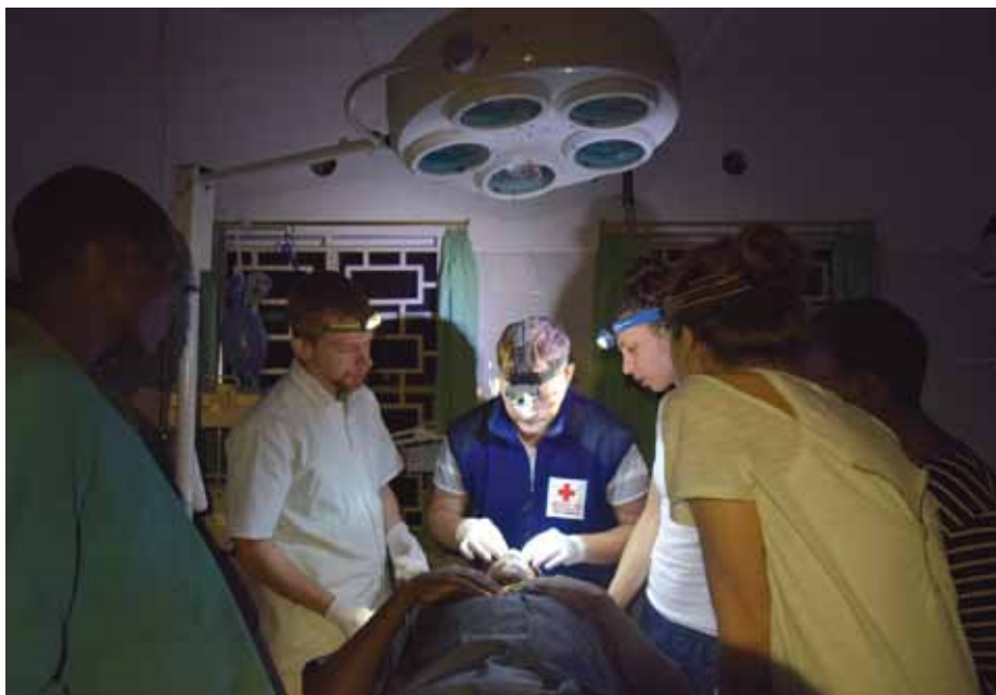
Při výpadku elektřiny bylo nutné spolehnout se na čelovky

Nejsem asi jediný, kdo se na Fakultu vojenského zdravotnictví do Hradce Králové vydal s ideálem zachraňovat v polní nemocnici životy ve vzdálených exotických zemích.