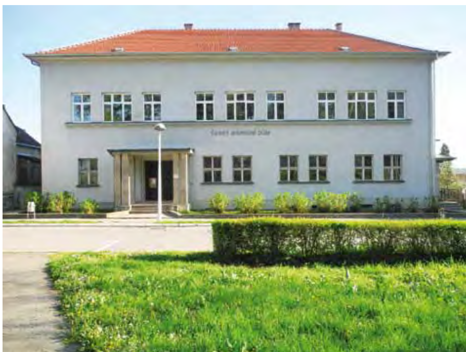
Budova, ve které je uložen archiv 1. československé brigády v Jugoslávii

Archiv brigády je uložen v Českém domě v Daruvaru. Řešitelskému kolektivu