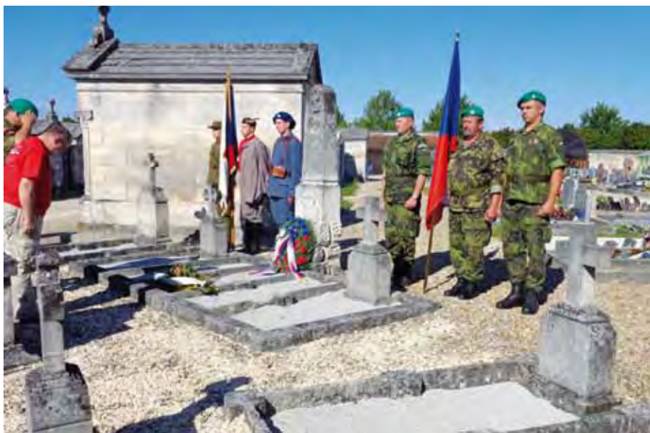
Pietní akt s hymnou