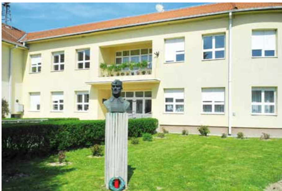
Základní škola v Končenicí nese jméno velitele 1. čs. brigády v Jugoslávii Josefa Růžicky

Univerzity obrany k formování požadovaných osobních vlastností na příkladech významných osobností druhého a třetího odboje“, ale může být dobrým odrazovým můstkem pro projekty připravované v oblasti vojenského umění.