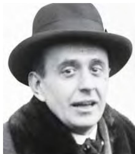
Jan Masaryk - za 2. světové války ministr zahraničních věcí čs. exilové vlády

zace – Itálie (1944), Mezinárodní soudní tribunál v Norimberku (1946), Německá demokratická republika (tzv. Východní Německo 1950), Organizace spojených národů (1968), Spolková republika Německo (tzv. Západní Německo 1973), Spolková republika Německo (tzv. Sjednocené Německo 1992, 1997). Všechny tyto smlouvy a dohody převzala do svého právního řádu po roce 1993 i samostatná Česká republika jako nástupnický stát bývalého Československa.