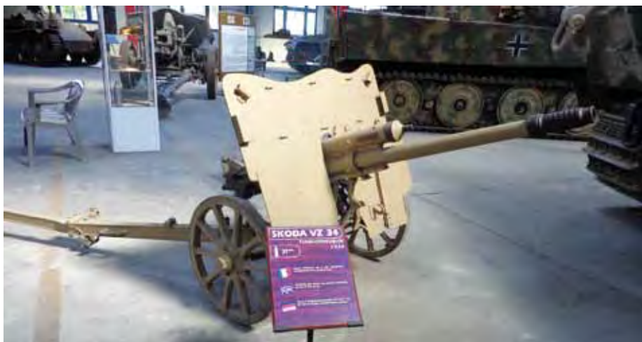
Dělo ze Škodovky

Po 14. hodině jsme zastavili u tankového muzea v Saumuru. Čekala nás prohlídka zejména těžké vojenské techniky. Muzeum bylo zřízeno po roce 1950. Vlastní sbírku více než 880 kusů těžké pancéřované techniky, z ní je pojízdných jen 220 strojů. Muzeum je členěno do sálů, například ten francouzský je pochopitelně pojat patrioticky, v dalším je umístěna třeba italská technika atd. Je zde také sál nejvýznamnějších obrněnců různých států, mezi nimiž nechybí Švédsko, Izrael, USA či stroje z naší Škodovky a je zde zastoupena i Tatra a OT. Jsou zde stroje ze státní bývalé Varšavské smlouvy od nejslavnějšího tanku T 34 až po mýtický T 72. K vidění je taky izraelský tank Merkava 1. Fotit se zde mohlo bez zábran. Dnes už na strojích není co skrývat. Více než dvě hodiny na prohlídku bohatě stačily. Jsme vojáci, tak dost stesků a nasedáme. Byla to poslední zastávka dnešního dne. Motor autobusu si brumlal svou jednotvárnou píseň po francouzské dálnici dalších 190 kilometrů, než jsme zastavili v místě noclehu. V Rennes Est-Cesson nás již čekala vytoužená postel.