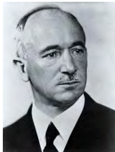
dr. Edvard Beneš - za 2. světové války exilový prezident ČSR

Spojenecké velmoci Francie a Velká Británie však zpočátku neměly zájem své mnichovské postoje vůči Československu jakkoliv revidovat či přehodnocovat. V jejich očích byla až do vypuknutí druhé světové války Mnichovská dohoda právoplatně uzavřenou mezinárodní smlouvou, přestože byla uzavřena proti vůli, v neprospěch a bez účasti zástupců ČSR a navíc nebyla nikdy československým parlamentem oficiálně ratifikována. Československé odbojové hnutí, reprezentované prezidentem E. Benešem a exilovou vládou v Londýně i domácím odbojem v okupované vlasti, naopak považovalo Mnichovskou dohodu za od počátku v rozporu s platnou československou ústavou a československým právním řádem, neboť byla Československu vnucenou pod hrubým diplomatickým nátlakem a hrozbou vojenské agrese. Z toho vyplýval také právní