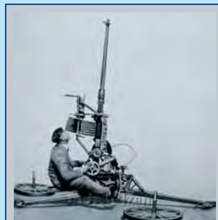
VKPL (Velkorážný Kulomet ProtiLetadlový) vz. 36 ráže 20 mm Oerlikon, dodaný na přelomu let 1937 a 1938 v počtu 229 kusů pro nově vytvořené roty velkých kulometů proti letadlům v rámci vojenských těles pěchoty.