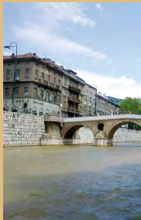
Nábřeží u Latinského mostu – dějiště atentátu