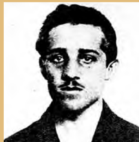
Fotografie Gavrila Principa pořízená po zatčení

K tomu je nutno započíst ztráty civilního obyvatelstva v zázemi, kde lidé po tisících umírali na válečná strádání, choroby a podvýživu, ke kterým se krátce po skončení války přidala v mnoha evropských zemích i epidemie tzv. španělské chřipky. Své mrtvé bojovníky, ať již v řadách rakousko-uherské armády či mezi legionáři má snad každé město i ta nejmenší veska v českých zemích, v každé z nich tyto oběti dodnes připomínají uchovávaná pietní místa v podobě pomníků a pamětních desek. Po roce 1945 byly