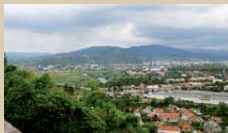
Pohled na město Mukačevo

Území Podkarpatské Rusi označoval na konci 30. let československý generální štáb ve svých mobilizačních plánech jako Hraniční oblast 42, kterou měla bránit 12. pěší divize bývalého legionáře brigádního generála Olega Svátka před hroící agresí horthyovského Maďarska. Na základě Vídeňské arbitráže z listopadu 1938 byla naše republika nucena odstoupit ve prospěch Maďarska jižní území Slovenska a Podkarpatské Rusi, které mj. zahrnovalo i karpatská města Užhorod a Mukačevo. Správní středisko Podkarpatské Rusi tak muselo být přeloženo z Užhorodu do města Chust. Když se 14. března 1939 od okleštěného Československa odtrhlo Slovensko a druhý den ráno začala české země okupovat německá armáda, mohli se českoslovenští vojáci těm maďarským, kteří s požehnáním Berlína začali okupovat zbylé území Podkarpatské Rusi, klidně vzdát a nechat se bez boje odzbrojit. Oni to však neudělali, protože čest byla pro ně stejnou hodnotou jako pro jejich velitele generála Olega Svátka a rozhodli se i za cenu vlastních životů podstoupit předem ztracený a beznadějný boj. Navíc s maďarskou armádou, která byla po všech stránkách hůře