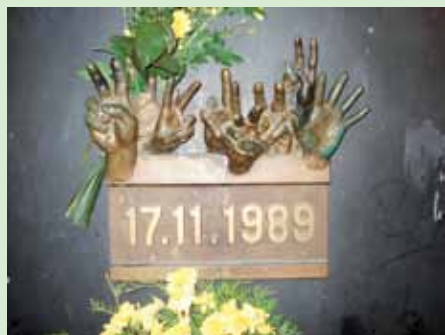
Památka na Národní třídě

Organizace Nezávislé studentské sdružení naplánovala na 17. listopad 1989 pietní akci k 50. výročí uzavření českých vysokých škol nacisty. Akce se měla odehrát na Albertově. Oficiálně měla být uctěna památka Opletala, ale ti radikálnější z účastníků počítali s tím, že se setkání vyvine v demonstraci proti komunismu. Různé zdroje hovoří o 15 až 50 tisících