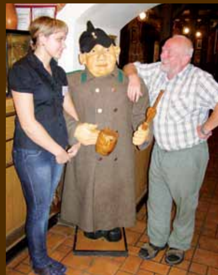
Švejkova hospoda v Rusku

Text a foto: JUDr. Jan Kux Cestovatel a badatel, oceněný titulem Český patriot 2009