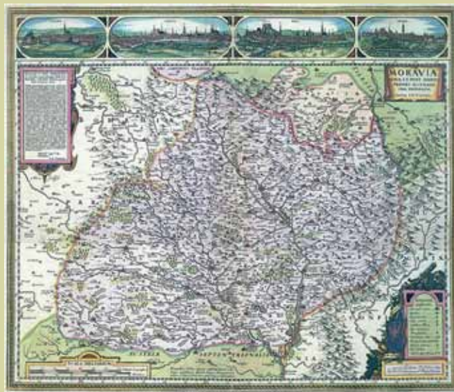
Komenského mapa Moravy z roku 1627

Kartografická společnost má v současné době zhruba sto individuálních členů a šest kolektivních. Podíl žen je zde asi dvacet pět procent.