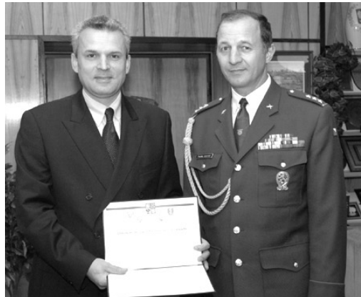
Zakládající listina UO v rukou ministra